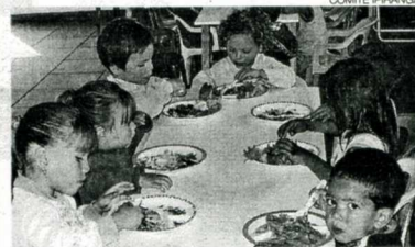
► Niños de Brasil a los que Ipiranga atiende.