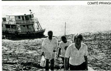
► Visitas domiciliarias en el barco hospital