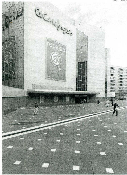
► Fachada de El Corte Inglés en Badajoz.

La mandataria municipal marcó que la operación ha llevado consigo "trabajos internos" y que ella ha peleado por El Corte