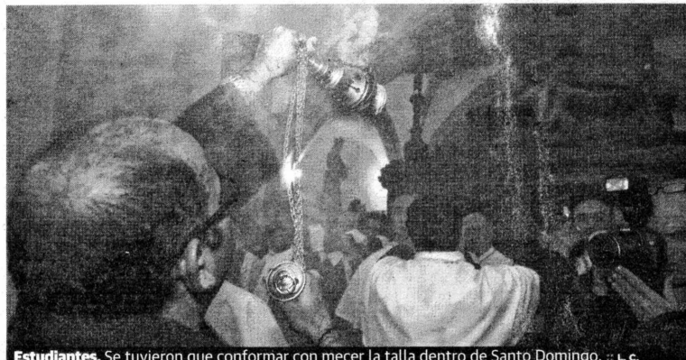
Estudiantes. Se tuvieron que conformar con mecer la talla dentro de Santo Domingo. :: L. c.