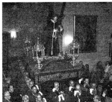
La Madrugada. El Nazareno, en Santiago. :: s.e.