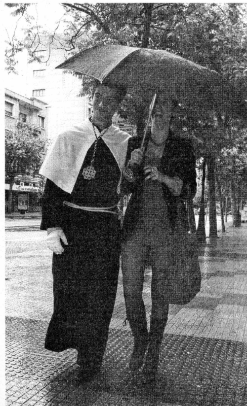
Bajo la lluvia. Un joven nazareno camino de la procesión.

ciones el próximo mes de noviembre. Continuaba la lluvia a eso de las once de la mañana, cuando los hermanos del Cristo de la Expiración y Nuestra Señora de Gracia y Esperanza se quedaron sin poder realizar su estación de penitencia desde San Mateo. Tampoco perdonó el agua a Los Estudiantes, que no pudieron estrenar su nuevo itinerario, ni a la cofradía de la Soledad y el Santo Entierro.