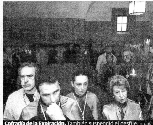
Cofradía de la Expiración. También suspendió el desfile.