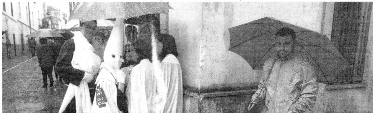
Viernes Santo pasado por agua. Un grupo de nazarenos aguarda bajo un paraguas la salida de la procesión del Santo Entierro.