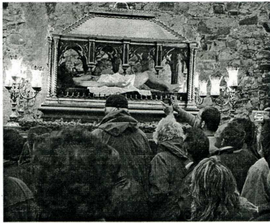
El Cristo yacente en su salida la tarde del Viernes Santo.