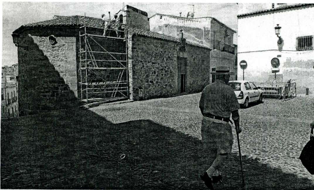
La ermita de la Soledad, junto a la calle Pizarro, arrastra goteras y humedades desde hace años. Ya han comenzado a reparar el tejado.