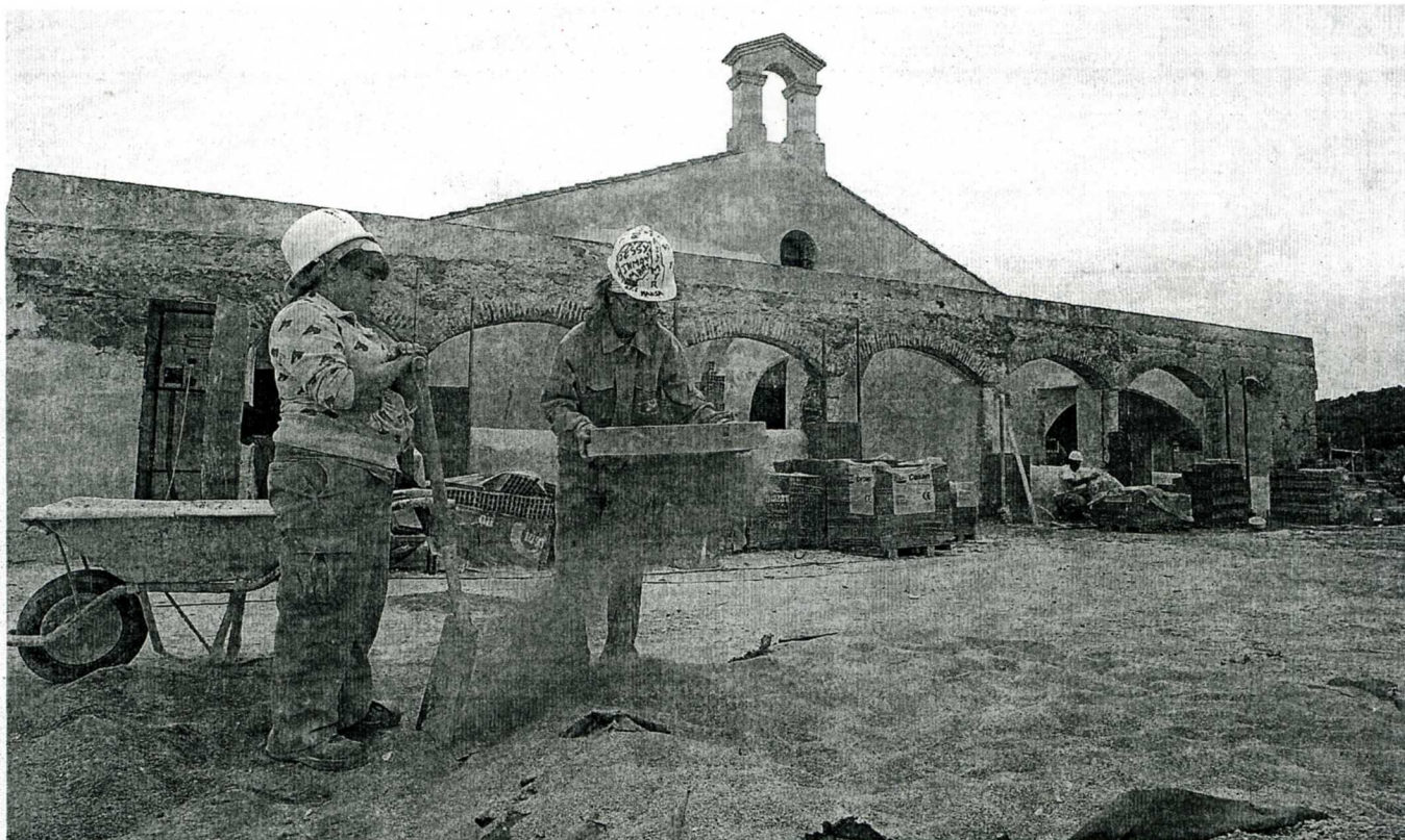
Dos alumnas de la escuela-taller San Benito II, de la Universidad Popular, trabajan en la rehabilitación del templo, situado en la urbanización Ceres Golf.